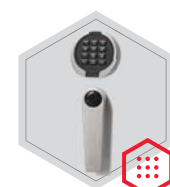
zamek elektroniczny Primor 3000 level 5