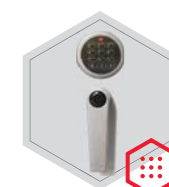
zamek elektroniczny Stellar Business