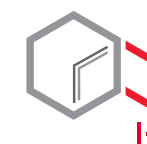
Drzwi wielościankowe o grubości 84 mm